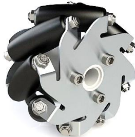
Abb. 3: Spezialräder