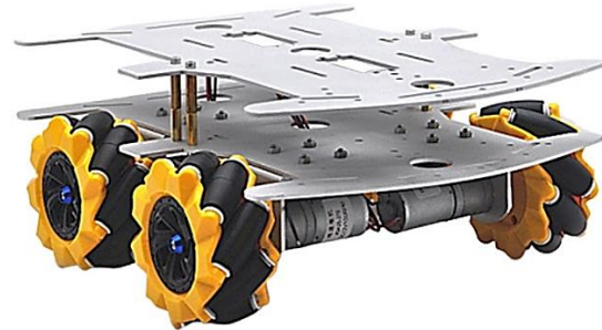
Abb. 4: Bewegliche Plattform mit Mecanum Rädern

Dieser Vergleich dient lediglich als Hilfsmittel, um dem Leser eine mögliche Vorstellung der von Hesekiel beschriebenen Räder zu vermitteln. Es könnte aber auch ganz anders sein.