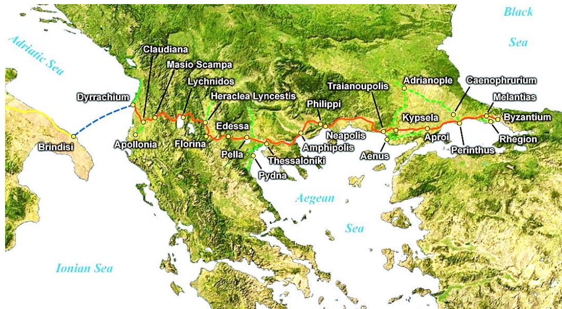
Abb. 3: Via Egnatia (rote Linie) 15

Paulus muss folglich bereits vor seinem dritten Besuch in Illyrien gewesen sein (möglicherweise nur in der betreffenden Grenzregion); davon aber berichtet uns Lukas kein Wort. Möglicherweise deswegen, weil er nicht in sämtliche Pläne des Apostels unmittelbar eingeweiht war.